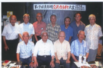
▲カラオケ大会に参加した皆さん

三金会は、名古屋地方本部と名古屋東、中村、守山、五寺、名古屋運輸車両の各支部の集まりですが、コロナ発症時期を除いて年間行事としてカラオケ大会(2回)や名所旧跡散策(1回)、他の支部と同様に納涼会や忘年会などの企画を織り交ぜて交流を進めて参りました。又、ほぼ毎月開催される定期