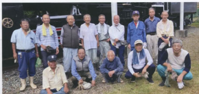
▲清掃作業に参加した皆さん

清掃作業中には、元機関士、機関助手から満員のお客様を乗せ紀勢線を力走、トンネル内では黒煙でひん死の状態になりか