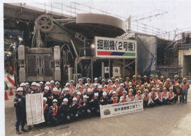
▲地中連続壁完了後の集合写真