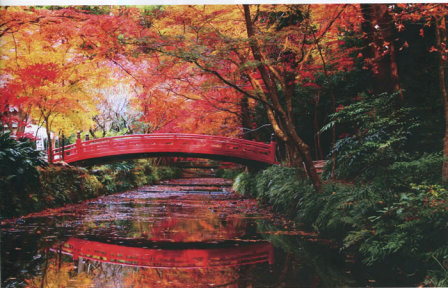
▲小浜神社の紅葉 静岡地方本部 菊川支部 八木 一貴